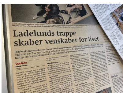
Ikke sjældent er en efterskole ramme, når der opstår venskaber for livet.