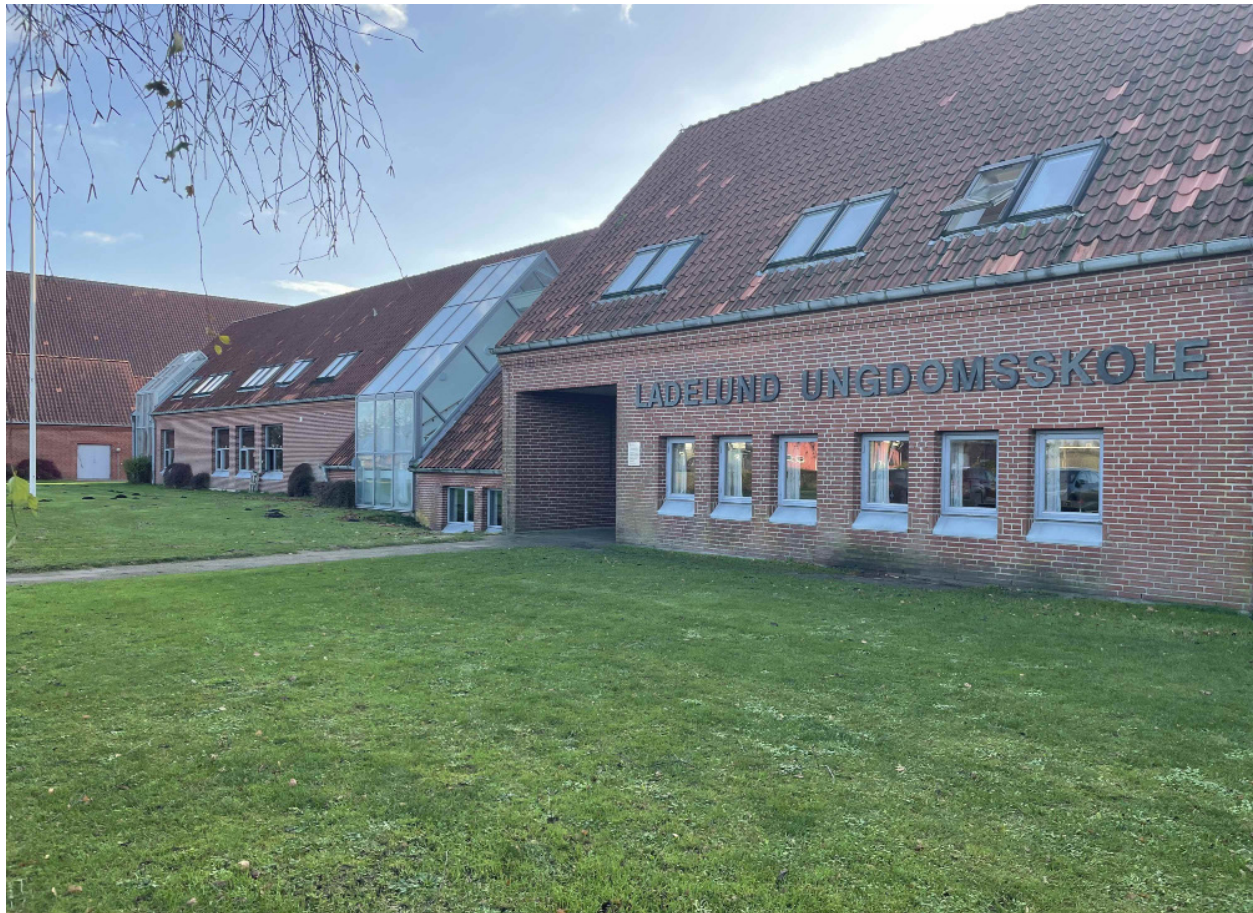
Ladelund Ungdomsskole er en skole og et hjem med både mål og trygge rammer for eleverne.

er en efterskole, der som andre efterskoler byder sine elever oplevelser og læring for livet, en anderledes hverdag, fornyet mod på skolegang, nære forbindelser og tætte venskaber.