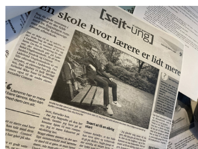
Relationen mellem lærer og elev bliver en anden, når skoledagen ikke slutter med undervisningen.