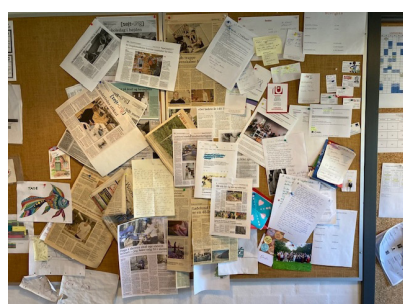
Opslagstavlen på kontoret er fyldt med gode historier om skolen.

Med det i baghovedet ved man, at det er en hård omgang at få vendt billedet fra »Balladelund« til »Chokoladelund«, men skolen fortsætter ufortrødent kampen. Og på et tidspunkt bliver den så måske bare accepteret som en god fortælling med navnet »Ladelund«.