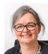
Redaktion: Trine Flamming, kommunikationsmedarbejder hos Skoleforeningen

Seit der Reform des Kita-Gesetzes im Jahr 2020 haben sie ein 1000-Stunden-Programm absolviert, das in vier Module unterteilt ist.