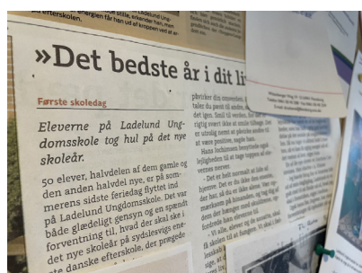
Et år på efterskole kan gøre en kæmpe forskel for et ungt menneske.