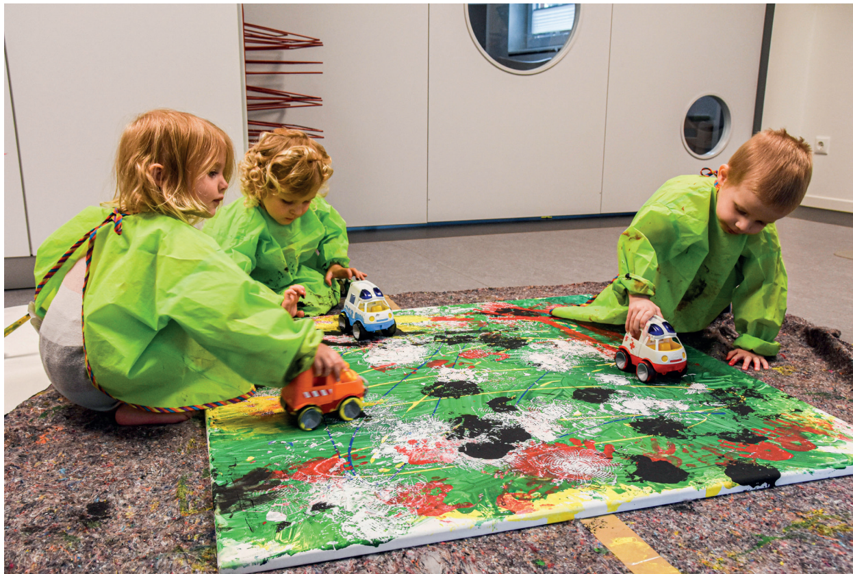
Masser af kreativitet under kunstprojektet i Skovlund.

Hos frøerne er penslerne lagt på hylden, og hænderne er taget i brug. Men det er helt, som det skal være, fordi en del af kunstprojektet er at blive introduceret til forskellige teknikker. I dag er de nået til at male, eller det er vist mere at bemale dyr og lave aftryk. Det er Mimbo Jimbos venner fra savannen, der er med. Midt på bordet,