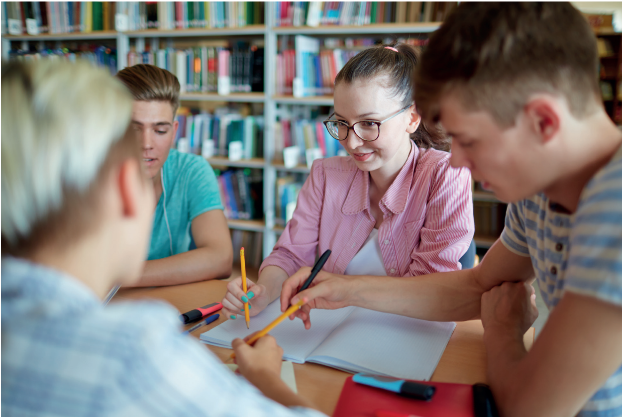
Undervisningsbogen er beregnet for elever i gymnasiet.