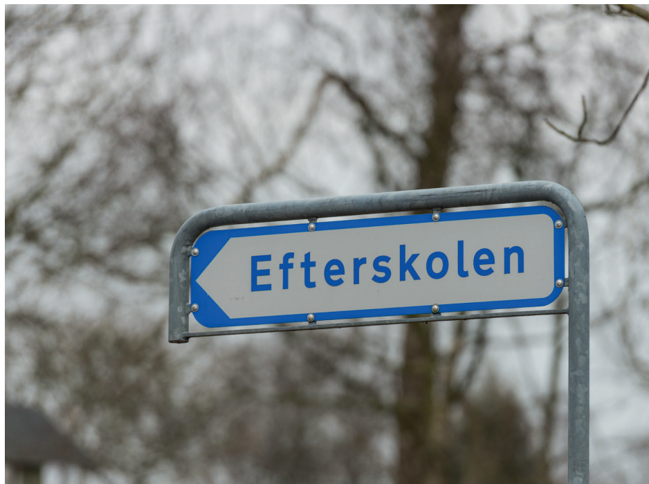
Er efterskole lige noget for dig?

I Danmark findes 240 efterskoler, og der er et væld af muligheder for at vælge fagretninger, størrelse