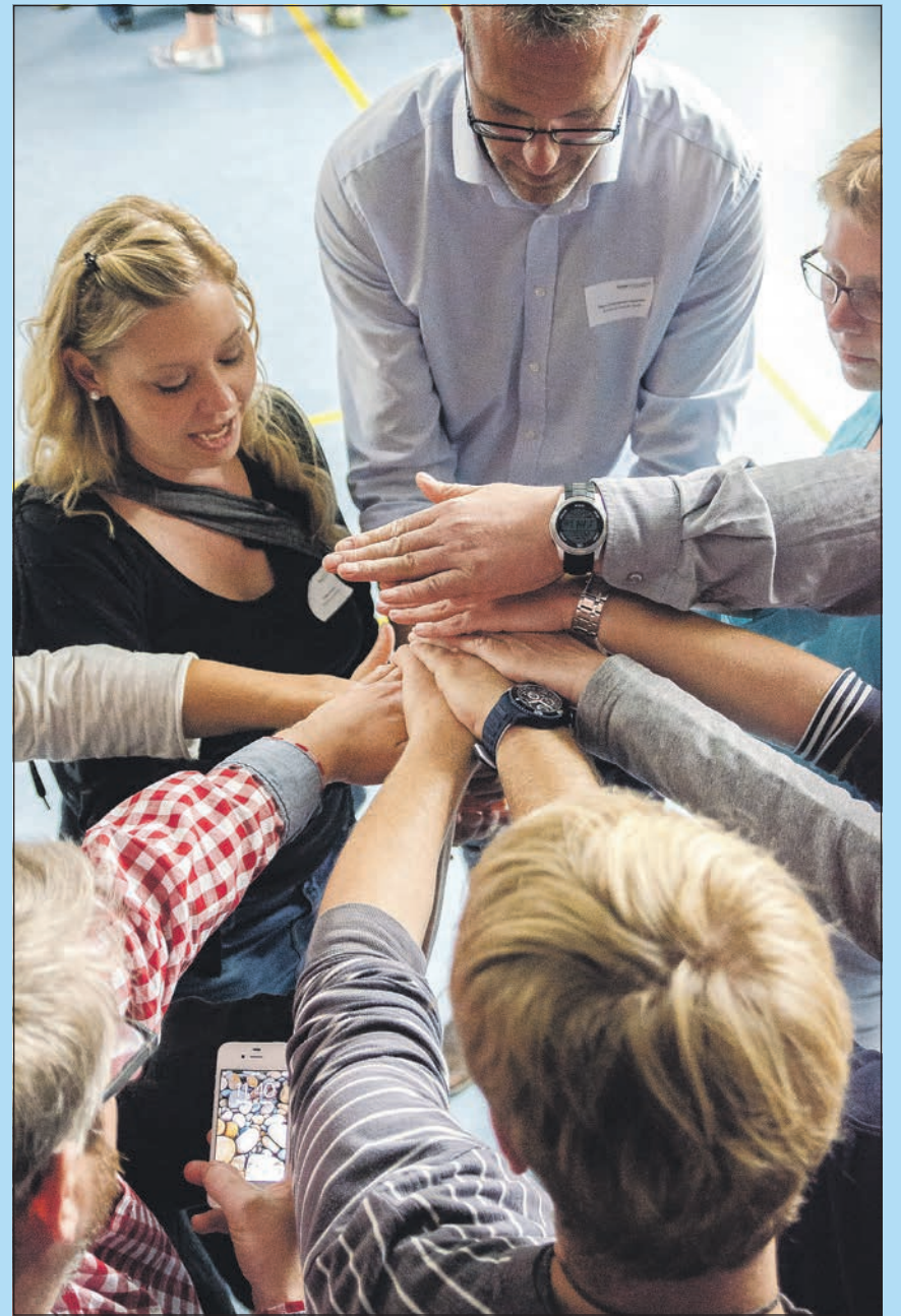
Teamøvelser sammen med kollegerne...