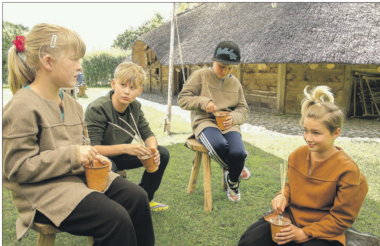
Eleverne fandt ud af, at det er hårdt arbejde at lave smør med håndkraft.

- Hos os oplever eleverne med alle sanser, og de er selv med til at bidrage med noget, siger hun.