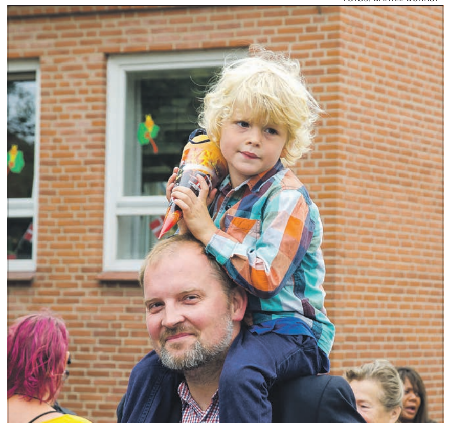
Der var også en Schultüte til de mindste