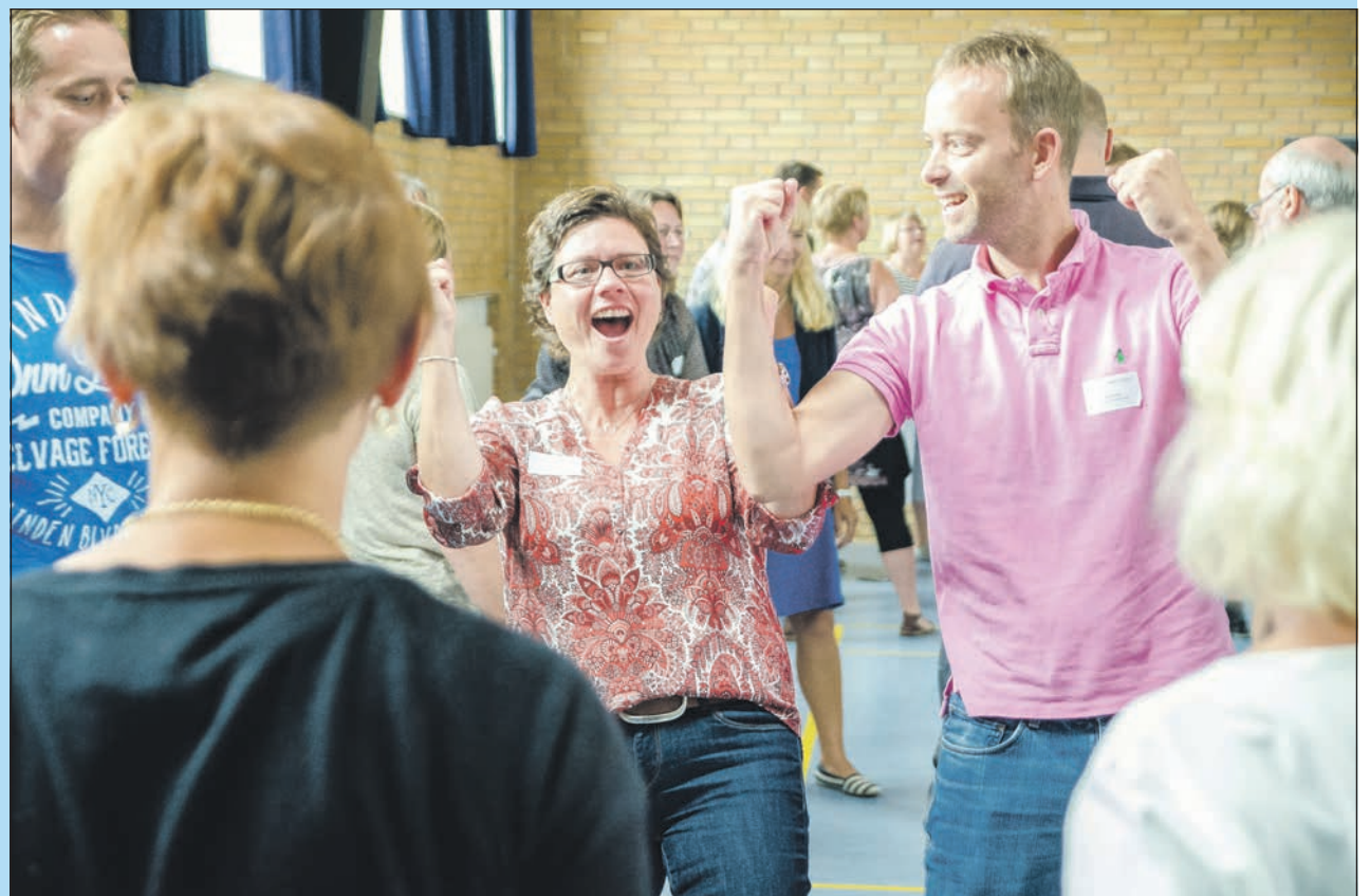
...gav en masse gode oplevelser.