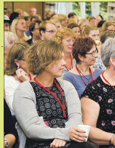
160 pædagoger var tilstede.