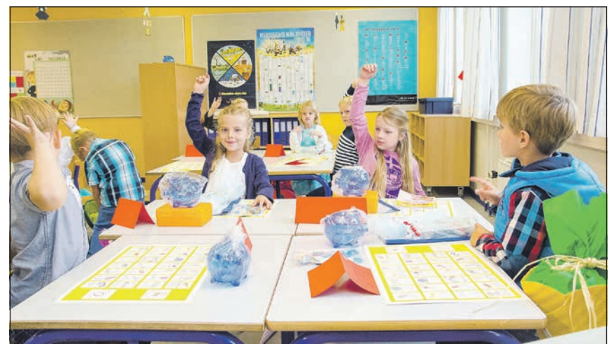
De nye elevers første time.

og sammen med jer kan vi nå langt – og kan vi så senere hen – om 9 – 10 år – et eller andet sted ude i landskabet – møde dette hold elever, der med en sikker udstråling siger: Jeg