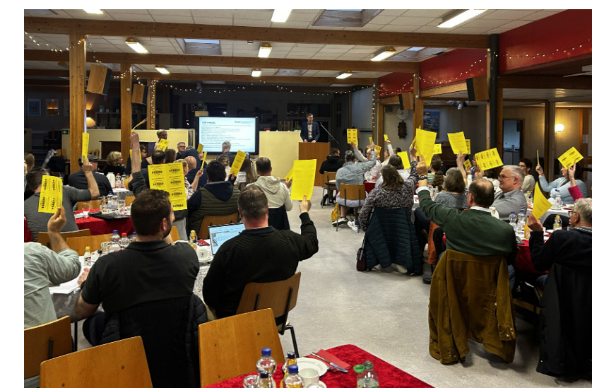
Der var stor enighed om beslutningerne på torsdagens fællesrådsmøde, der blev holdt på Lyksborg Danske Skole.

Både regnskab og budget blev godkendt uden modstemmer. Inklusiv en afsluttende fælles-sang sluttede mødet en halv time tidligere end forventet.