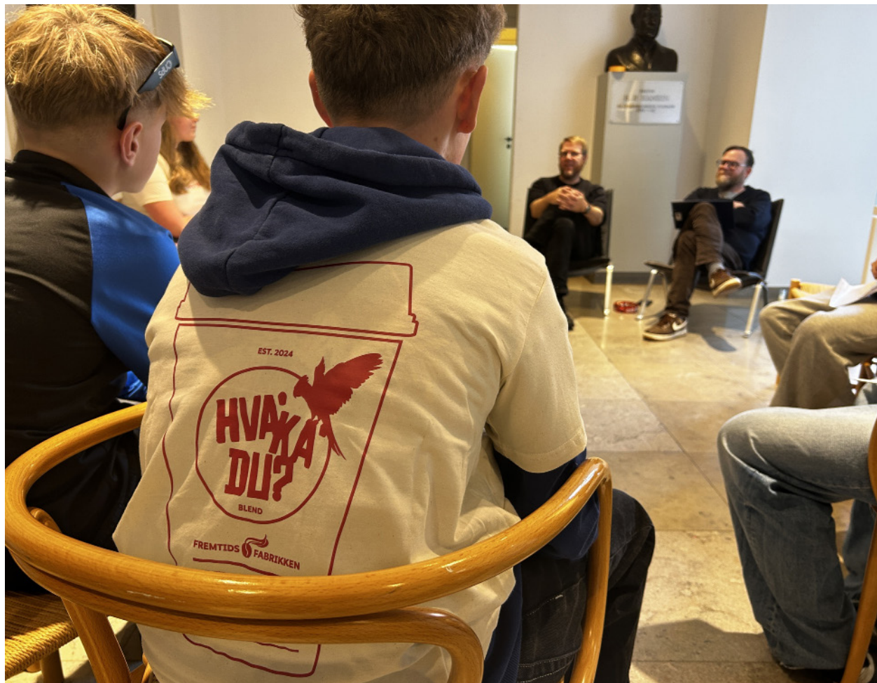
På Fremtidsfabrikken havde de unge fra skolernes Sydslesvig-Crews mulighed for at luften deres fordomme om mindretallets organisationer. Og det gjorde de.

Det var kendetegnende for talelysten i de forskellige grupper, at når eleverne først var kommet i gang, gik det hele meget lettere, og så kom der en del på bordet.