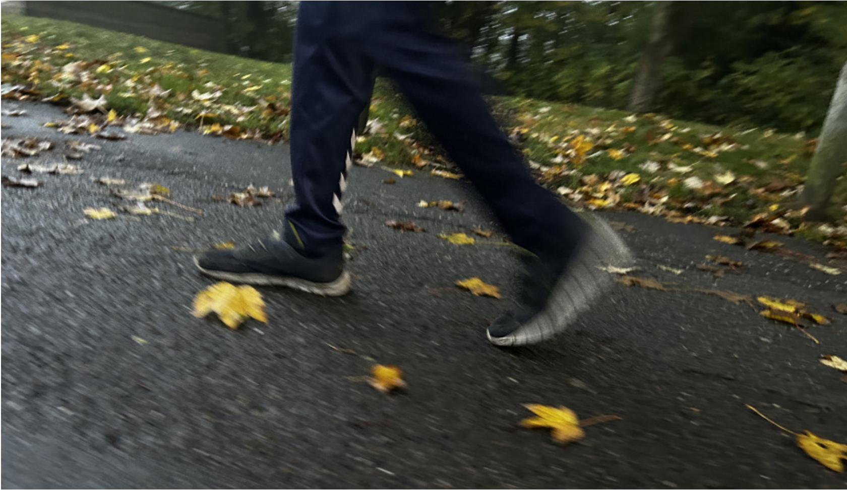
Efterår + børnefødder i bevægelse = motionsdag. Sådan er det på de fleste danske skoler dagen før efterårsferien – også i Sydslesvig.