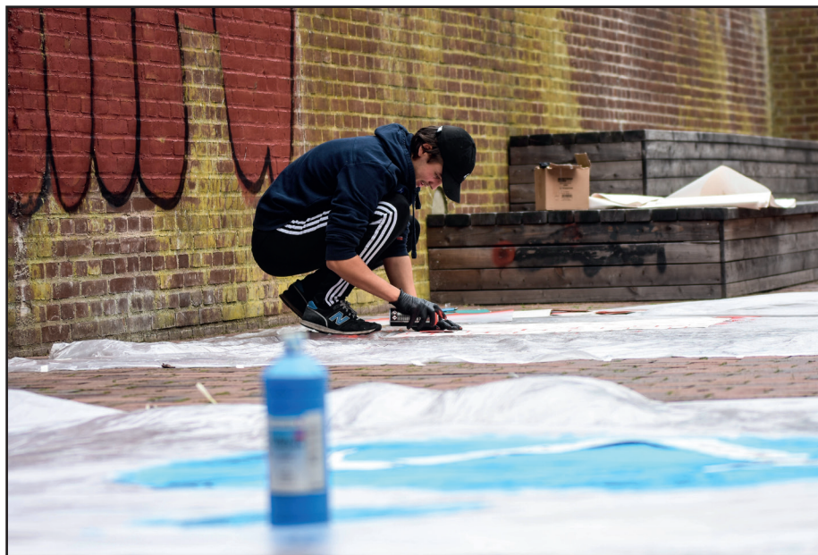
Emne- ugen har resulteret i en række produkter. Blandt andet graffiti.

Sammenkomsten i festsalen afsluttedes med kage til alle i anledning af A. P. Møller Skolens fødselsdag, der i år for fjerde år i træk også lagde dato til legatoverrækkelsen ved Ejderlandets Samfund.