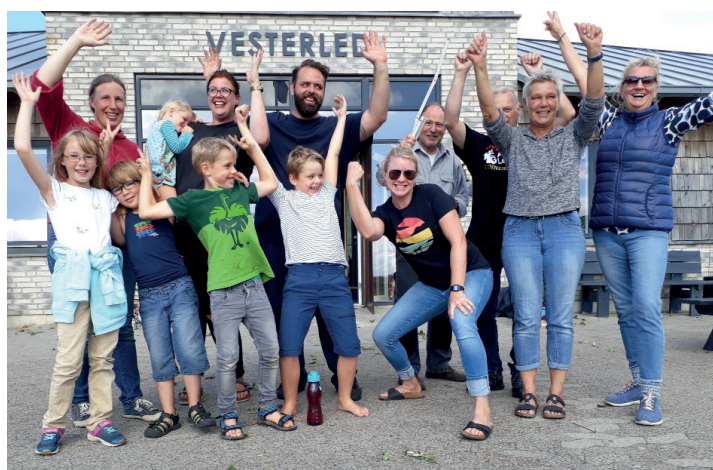
Oprydningsholdet på lejrskolen Vesterled

Bjørns mission er at give børnene nogle tidløse løsninger, så de bedre kan guide sig selv igennem hverdagen uden at fortvivle, når de støder på en udfordring, men i stedet tage en af vanerne frem fra rygsækken og bruge den til at løse problemerne. Meget håndgribeligt peger